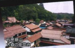
石見銀山 大森の街並み