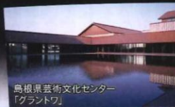
島根県芸術文化センター「グラントウ」