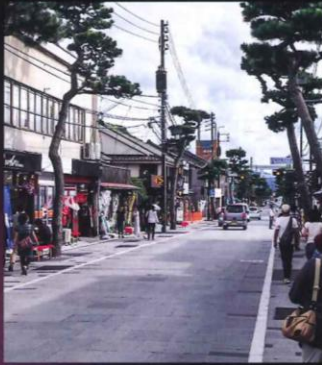
出雲大社神門通り

秋以降は、『鬼々の國 石見』で石見神楽の勇壮な舞いが人々を魅了。さらに旧暦十一月には遷宮後初の『神迎え神事 神在り祭』も執り行われ、島根は神々で染まります。 六十年に一度、一生に一度の機会です。ぜひお出かけください。