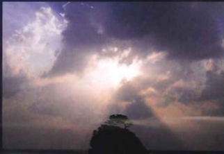
神迎え神事が行われる大社町稲佐浜

旧暦の11月 日本全国は『神無月』となりますが、ここ島根だけは『神在月』となります。全国から八百万神がこの地に集まれ、『縁結びなどの神諮り(会議)』が行われ、全国の皆様の“縁々な縁”が決められるということ。縁結びの神様といわれる所以です。 すべての神様がお集まりになられますから、ご利益のパワーは計り知れないものかもしれません。