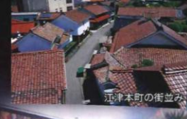
江津本町の街並み