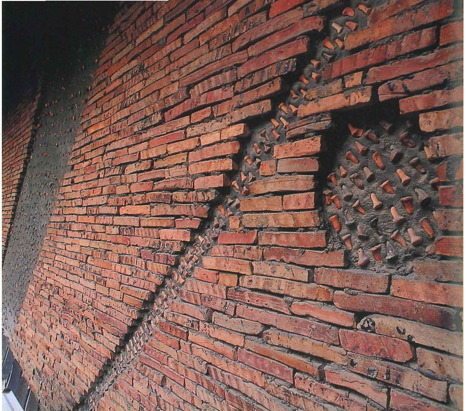
▲島根県・江津市庁舎【設計：吉阪隆正氏+U研究室】の東側外壁 1962年(昭和32年)の竣工当時、石州瓦産地の登り窯な中で使われていた「 棚をかける棒(モミツチ) 」と「 棚の上に瓦の素地を置くための駒(ハセ) 」で埋め尽くされたレリーフ