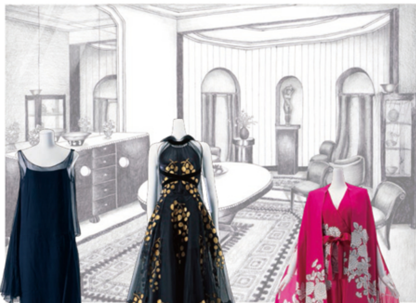
Alto Paredes (1977-1978-1979, 2016)